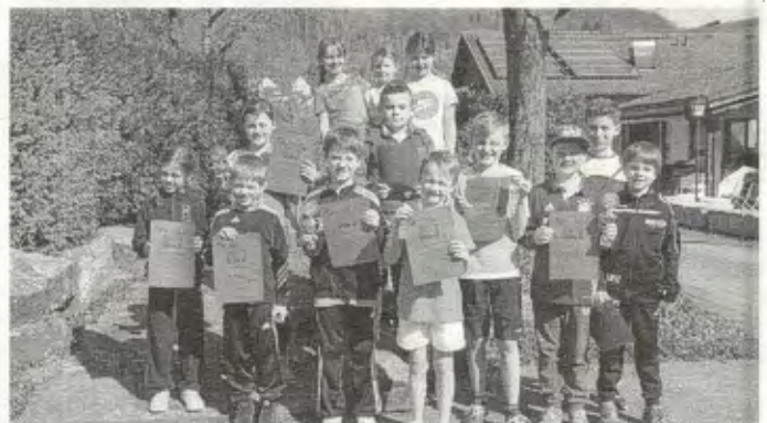
U10-Kleinfeld und Midcourt-TeilnehmerInnen

35 Jungen und Mädchen aus den Tennisvereinen Deggingen, Grubingen, Wiesensteig, Berghülen, Westerheim, Jesingen und Bad Ditzzenbach traten am vergangenen Sonntag zum Tennishallenturnier in Gosbach an. Einige Kinder bestritten ihr allererstes Turnier und waren deshalb sehr aufgeregt. Für