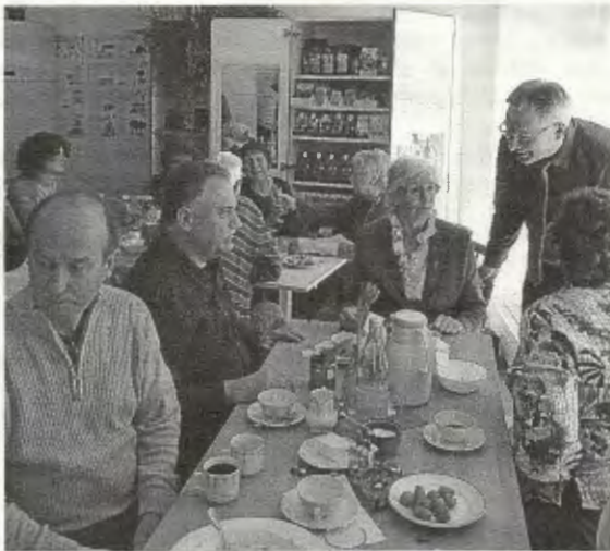
Fortsetzung auf Seite 6

Wir hatten am vergangenen Samstag zum Begegnungs-Frühstück in den Treffpunkt Miteinander eingeladen. Jeder unserer Gäste, der den Weg von weiter, z. B. aus München, oder von nebenan in den Treffpunkt fand, war begeistert über die Vielfalt an nationalen und internationalen Speisen. Wir und die Flüchtlinge freuten uns bekannte und neue Gesichter zu sehen, zu reden, uns auszutauschen und vor allem gut zu frühstücken. Seit Samstag gibt es im Treffpunkt Miteinander noch eine weitere Möglichkeit der Begegnung: den FAIR STAND. Er wird zukünftig montags auch von 15:30 - 18:00 Uhr geöffnet sein.