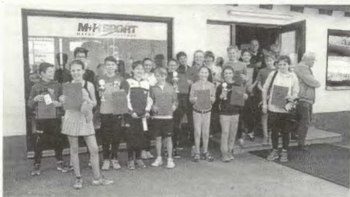
Die KIDS-Cup U12, Mädchen U14 und Knaben U14 Teilnehmer/-innen

Allen Helfern und Organisatoren ein herzliches Dankeschön!