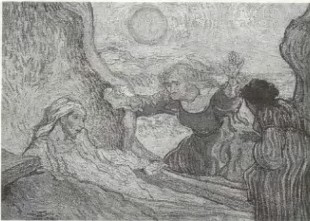
Vincent van Gogh, Die Auferweckung des Lazarus, 1890

Kirchengemeinde St. Laurentius - Bad Ditzenbach